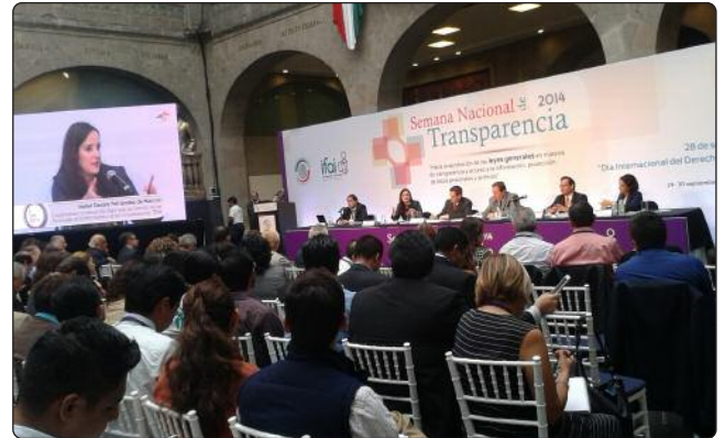
Los retos y desafíos de cara a la implementación del nuevo Sistema Nacional de Transparencia, fueron abordados durante los paneles organizados por el IFAI.