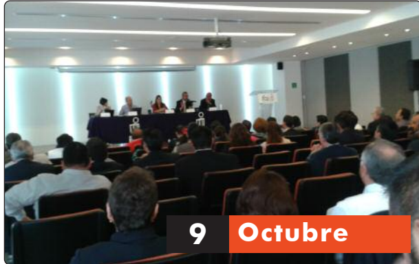
El Taller se llevó a cabo en el Auditorio Alonso Lujambio del IFAI.