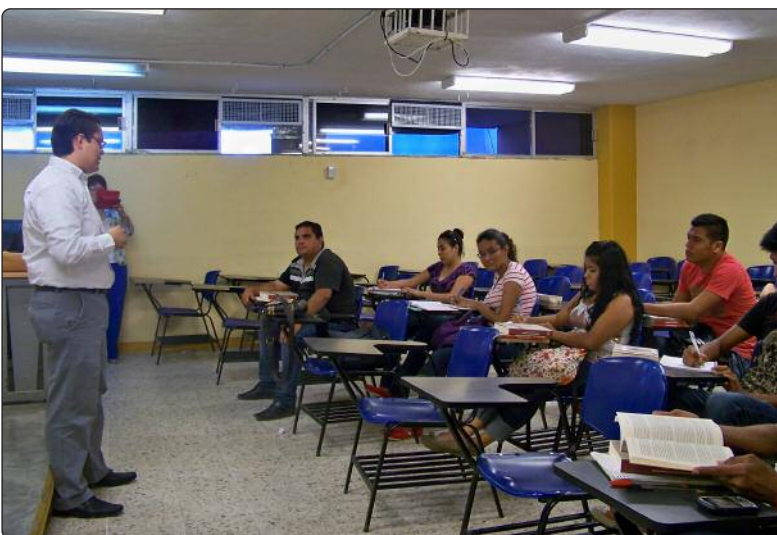
Entrega de material bibliográfico y plática sobre Derecho a la Información a estudiantes de la Unidad Académica de Derecho y Ciencias Sociales de la UAT.

A fin de sumar esfuerzos en favor de la creación de una cultura de la transparencia entre los estudiantes universitarios, el ITAIT ha impulsado la impartición de las materias de Acceso a la Información y Transparencia que se imparten en la Unidad Académica de Derecho y Ciencias Sociales de la UAT y en la Carrera de Derecho de la Universidad La Salle Victoria, respectivamente.