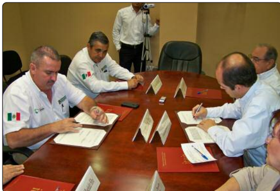
Firma del Convenio de Colaboración entre el Instituto de Transparencia y Acceso a la Información de Tamaulipas y el sistema ITACE.

En reunión Plenaria del Instituto de Transparencia, se llevó a cabo la firma del Convenio de Colaboración Institucional entre el ITAIT y el Instituto Tamaulipeco de Capacitación para el Empleo (ITACE), sumando una alianza más en favor de la difusión del Derecho a la Información, la Transparencia y la Rendición de Cuentas en la entidad.