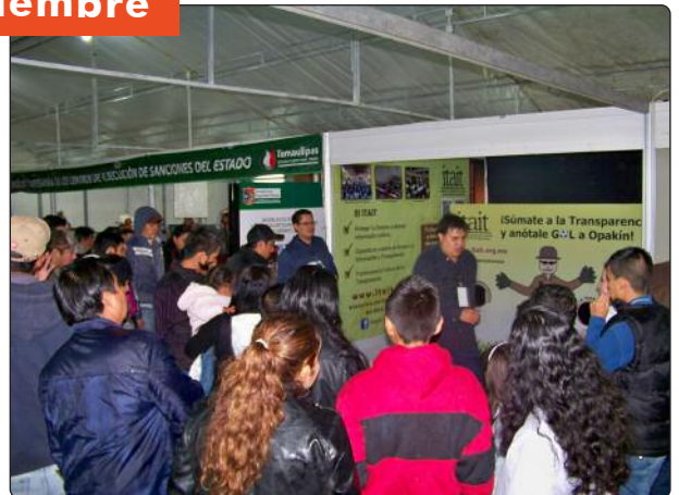
Entretenida actividad deportiva la que ofreció el ITAIT durante la participación en la Feria Estatal, lo que atrajo a un importante número de visitantes que participaron y recibieron información y obsequios del Instituto.