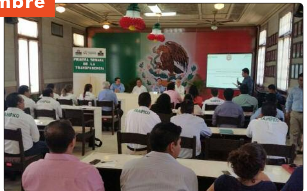
La Semana de la Transparencia Tamaulipas 2014 culminó en el municipio de Tampico, donde se desarrollaron foros en materia de transparencia, a fin de que la sociedad conozca detalladamente los beneficios del derecho a la libertad de información pública en el estado.