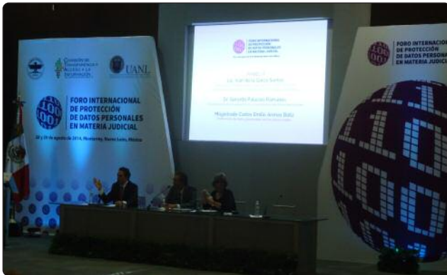
El Derecho a la Protección de Datos Personales, tema de gran importancia en la actual agenda Nacional de Transparencia.