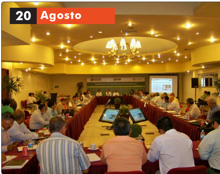
Participación del Instituto de Transparencia en la Reunión Estatal de Supervisores de Educación Secundaria.

A fin de abrir espacios que propicien el acercamiento del ITAIT con el amplio sector educativo y dar seguimiento al desarrollo de la asignatura estatal “Formación Ciudadana Democrática para una Cultura de la Legalidad en Tamaulipas”, que se imparte en primero de Secundaria y que incluye temas sobre el Derecho a la Información, transparencia y el Instituto de Transparencia, funcionarios del ITAIT participaron en reunión Estatal de Supervisores de Educación Secundaria en el Estado, para exponer el trabajo educativo que el Instituto ha desarrollado por más de 5 años, a fin de seguir impulsando la difusión de la Transparencia y la Protección de Datos Personales entre los alumnos de ese nivel educativo.