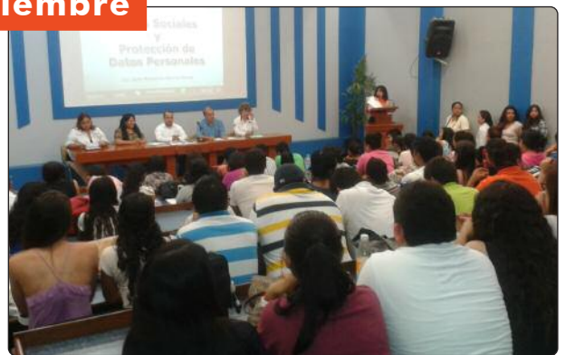
En el municipio de Madero se dio inicio a las actividades de la Semana de la Transparencia 2014, donde se desarrollaron diversas actividades de capacitación y difusión en materia de transparencia, derecho a la información y protección de datos personales, en coordinación con el Ayuntamiento.