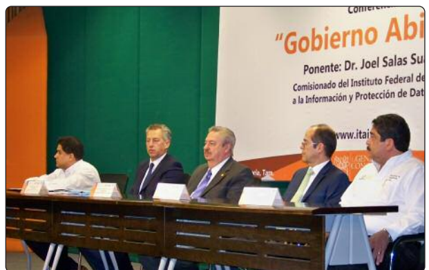
"Gobierno Abierto" ante la comunidad universitaria de la UAT.