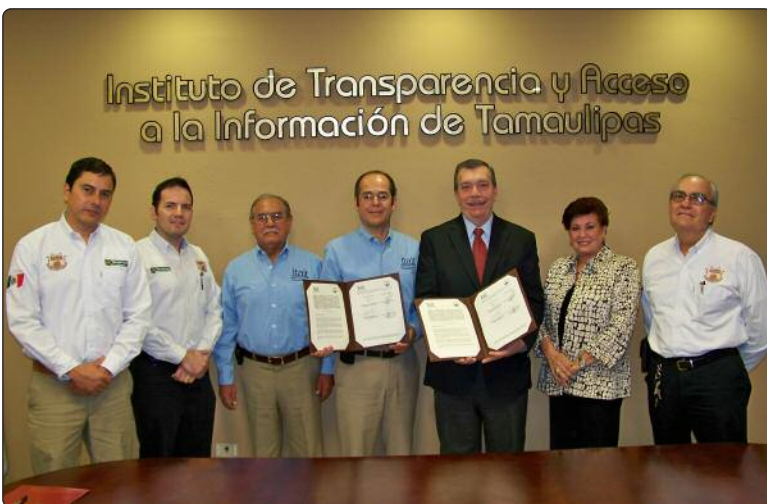
ITAIT y el Colegio de Tamaulipas ratifican acuerdo en favor del desarrollo de actividades comunes en materia de análisis e investigación relacionados al Derecho a la Información y la Protección de Datos Personales.