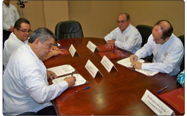
Firma del Convenio de Colaboración entre el Instituto de Transparencia y el Tribunal Electoral de Tamaulipas.