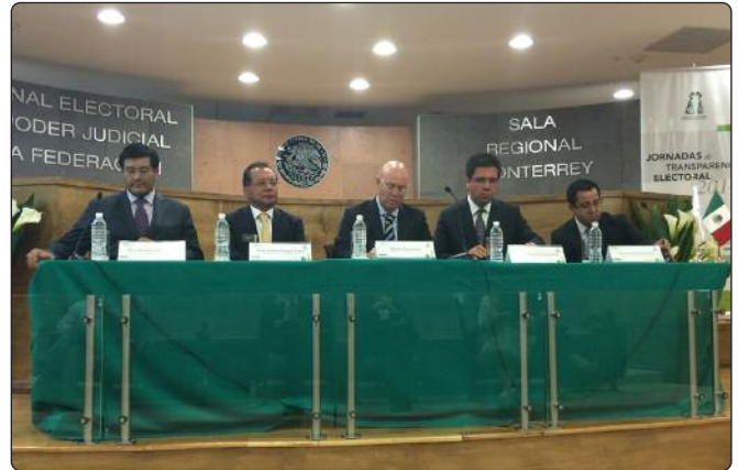
El Instituto de Transparencia estuvo presente en las "Jornadas de Transparencia Electoral 2014" organizadas por la Sala Regional del Tribunal Electoral del Poder Judicial de la Federación.

Teniendo como marco las Jornadas de Transparencia Electoral 2014, organizada por la Sala Regional Monterrey del Tribunal Electoral, se llevó a cabo la firma de convenios de colaboración en la materia de difusión y capacitación del Derecho a la Información, la Transparencia y la Rendición de Cuentas con los institutos garantes de ese derecho en Aguascalientes, Coahuila, Guanajuato, Nuevo León, Querétaro, San Luis Potosí, Tamaulipas y Zacatecas, estados que conforman la segunda circunscripción electoral.