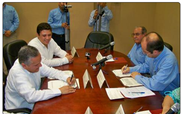
Firma del convenio de colaboración institucional entre el ITAIT y el Ayuntamiento de Tampico, mecanismo de colaboración para el desarrollo de actividades conjuntas en materia de capacitación y difusión del Derecho a la Información, la Transparencia y la Rendición de Cuentas.