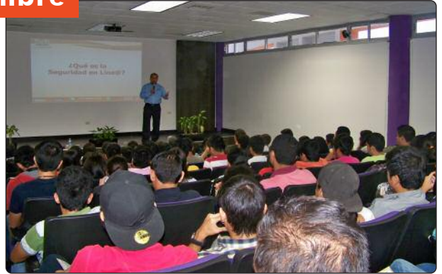
En coordinación con el Ayuntamiento de Victoria, se desarrolló un taller de capacitación a servidores públicos municipales, así como la conferencia "Redes Sociales y Protección de Datos Personales" a estudiantes de la Universidad Politécnica de Ciudad Victoria.