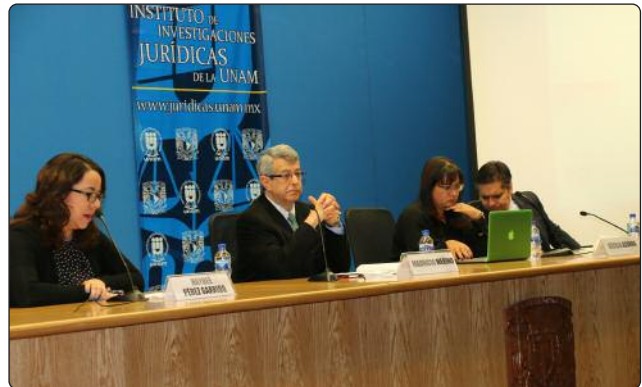
Coloquio Internacional “Hacia el Sistema Nacional de Transparencia”