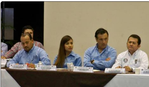
Funcionarios del ITAIT expusieron el trabajo de coordinación a desarrollarse con los Ayuntamientos, para facilitar el ejercicio del Derecho a la Información y el cumplimiento de las obligaciones de transparencia.

Convocados por la Secretaría de la Contraloría Estatal, que encabeza la Doctora Gilda Cavazos Lliteras, el Instituto de Transparencia y Acceso a la Información de Tamaulipas, participó en la "Reunión de Trabajo con funcionarios municipales en materia de Fiscalización, Mejora de Gestión y Transparencia" a fin de colaborar con diversas propuestas de coordinación en favor del desarrollo de mejores prácticas en la gestión gubernamental de los municipios.