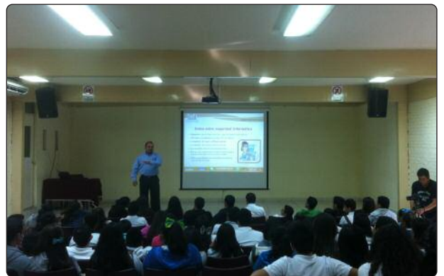
Conferencia “Redes Sociales y Protección de Datos Personales a Estudiantes del CBTIS 24 de Ciudad Victoria.