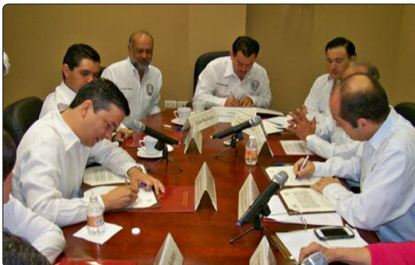
Firma del Acuerdo de Colaboración, que establecen los mecanismos de cooperación en favor del fortalecimiento de la política de transparencia en la entidad.