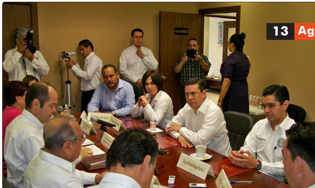
Durante la reunión se expusieron diversos temas sobre el fortalecimiento de la política de transparencia en Tamaulipas.

En Sesión Extraordinaria celebrada en la Sala de Sesiones del Instituto, el H. Congreso del Estado y el ITAIT ratificaron colaborar de manera activa en el fortalecimiento de la política de transparencia en beneficio de la sociedad, al firmar el Acuerdo de Colaboración Institucional, marco normativo para sumar esfuerzos coordinados en favor de garantizar el efectivo ejercicio de la libertad de información pública en Tamaulipas.