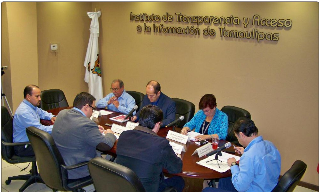
Las sesiones ordinarias del Pleno del Instituto se transmiten en vivo a través de la página de internet.

De fechas 11 de Julio, 5 de Agosto, 13 de Agosto, 19 de Agosto, 25 de Agosto, 27 de Agosto, 2 de Septiembre, 8 de Septiembre, 8 de Septiembre, 17 de Septiembre, 23 de Octubre, 24 de Octubre, 20 de Noviembre y 24 de Noviembre.