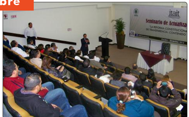
El Comisionado del IFAI Francisco Javier Acuña Llamas, disertó magistral conferencia "Transparencia y Partidos Políticos."