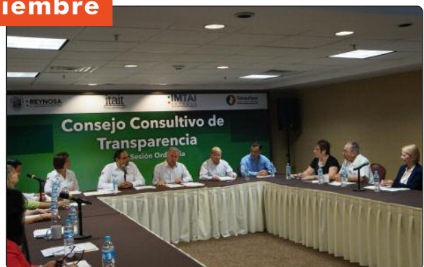
Intensa actividad se desarrolló en el municipio de Reynosa, en el que se llevó a cabo un taller de capacitación municipal, reunión de trabajo con el Consejo Consultivo de Transparencia y pláticas sobre Derecho a la Información con organizaciones de la sociedad civil y estudiantes.