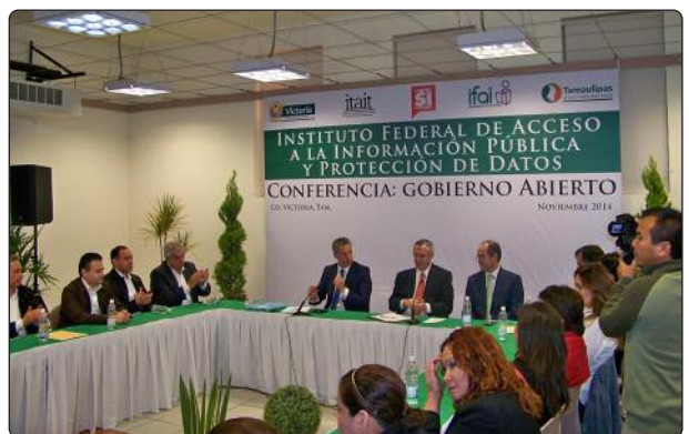
Reunión con el Cabildo y Funcionarios del Municipio de Victoria.