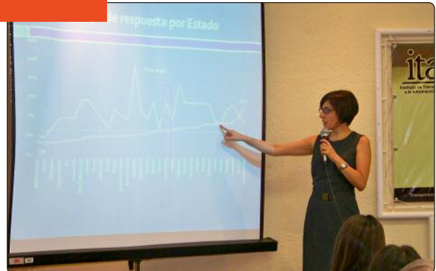
En su disertación la investigadora del CIDE, mostró información sobre evaluaciones aplicadas a las políticas de transparencia que permiten encontrar áreas de oportunidad para mejorarlas.