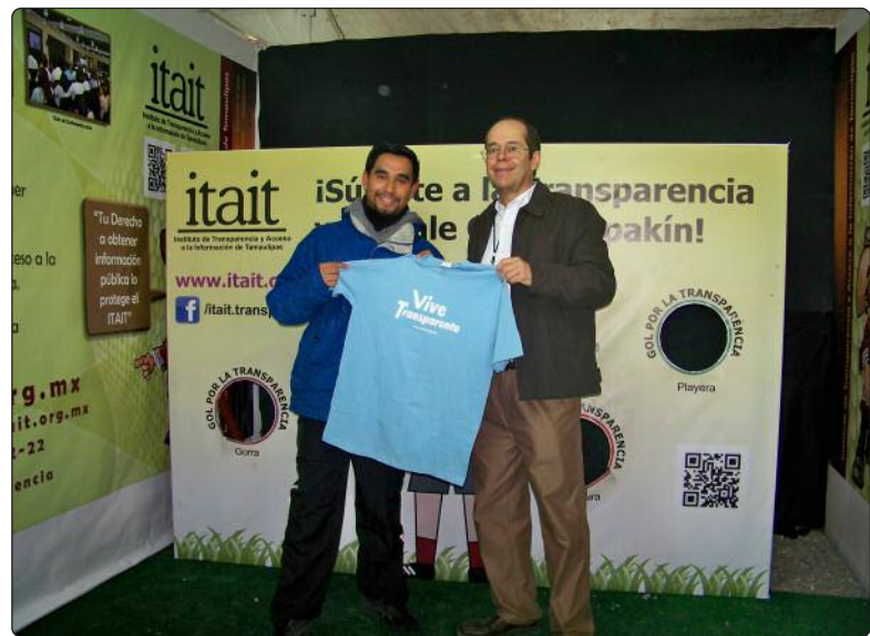
Importante espacio de difusión la participación del ITAIT en la Feria Estatal Tamaulipas 2014, donde además se propició el acercamiento del Instituto con la sociedad.

En el ITAIT, nos hemos preocupado por difundir la transparencia y la rendición de cuentas en todos los sectores de la sociedad; por esa razón, decidimos participar en la edición 2014 de la Feria Estatal Tamaulipas. Del 8 al 15 de noviembre, donde tuvimos la oportunidad de interactuar con las personas que se dieron cita a esta celebración, ofreciénd un espacio informativo y de diversión que a través de una actividad deportiva conocieron del Instituto. Espacio en el que se entregaron obsequios a los participantes; donde personal del Instituto participó activamente ofreciendo información y orientación sobre las actividades del ITAIT.