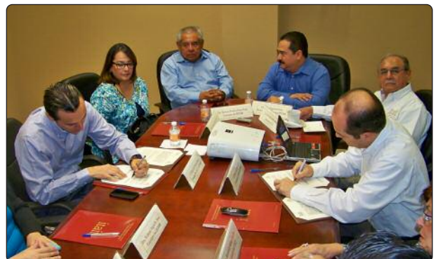
Con la firma del Acuerdo se crea el mecanismo de colaboración para la difusión de la Cultura Cívica y la Transparencia en trabajo coordinado entre el ITAIT y el IETAM.