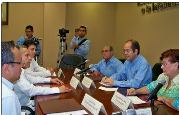
Durante la sesión de trabajo, los Comisionados del Instituto expusieron el trabajo desarrollado por el Instituto, capitalizado a través de la firma de acuerdos con diversos organismos públicos, educativos y sociales en favor del Derecho a la Información.