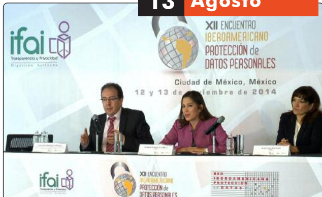
“Panel: Hacia un nuevo Infomex” y “Diálogo Nacional entre Órganos Garantes hacia un Gobierno Abierto”

El Instituto de Transparencia y Acceso a la Información de Tamaulipas, participó en el taller de “Protección de Datos Personales” con aplicación normativa en el sector público y privado, evento organizado por el Instituto Federal de Acceso a la Información y Protección de Datos (IFAI), en el marco del XII Encuentro Iberoamericano de Protección de Datos.