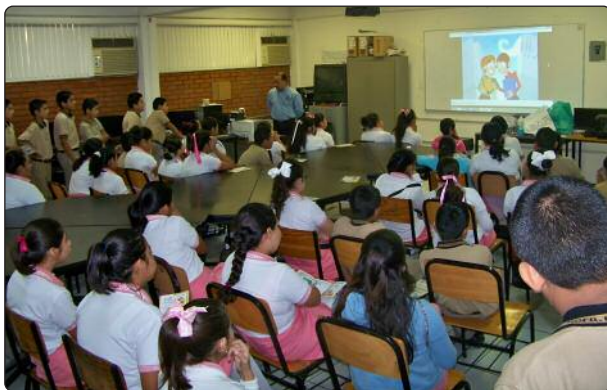
Conferencia “Redes Sociales y Protección de Datos Personales a Estudiantes de la Secundaria General No. 7 de Ciudad Victoria.