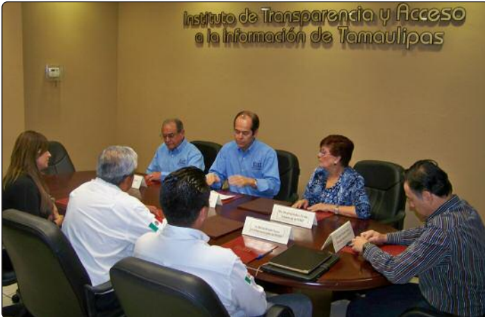
Durante la reunión Plenaria los Comisionados del ITAIT dieron la bienvenida al nuevo acuerdo de colaboración, que permite la difusión de los beneficios de la libertad de información pública, entre un importante universo de maestros, padres de familia y poco más de 10 mil estudiantes.

En reunión Plenaria del ITAIT, se llevó a cabo la firma del Convenio de Colaboración, entre el Instituto de Transparencia y el Colegio Nacional de Educación Profesional de Tamaulipas (CONALEP) con lo que se suma una importante alianza en favor de la difusión del Derecho a la Información, la Transparencia y la Protección de Datos Personales en Tamaulipas.