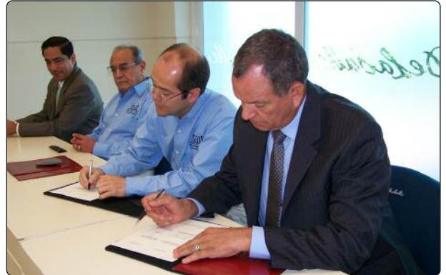
Firma del Convenio de Colaboración Institucional entre el ITAIT y la ULSA Victoria.