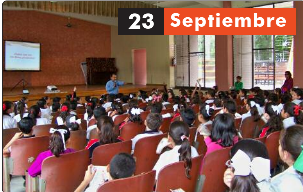
Plática de Redes Sociales y Protección de Datos Personales a niños la primaria Leona Vicario de Ciudad Victoria.

Funcionarios del Instituto impartieron además conferencias y talleres sobre Derecho a la Información, Transparencia y Protección de Datos Personales, en reuniones realizadas en coordinación con los Ayuntamientos, a las que asistieron estudiantes, académicos, servidores públicos, sociedad civil y grupos organizados, quienes conocieron del trabajo del ITAIT como órgano garante del Derecho a la Información en Tamaulipas.