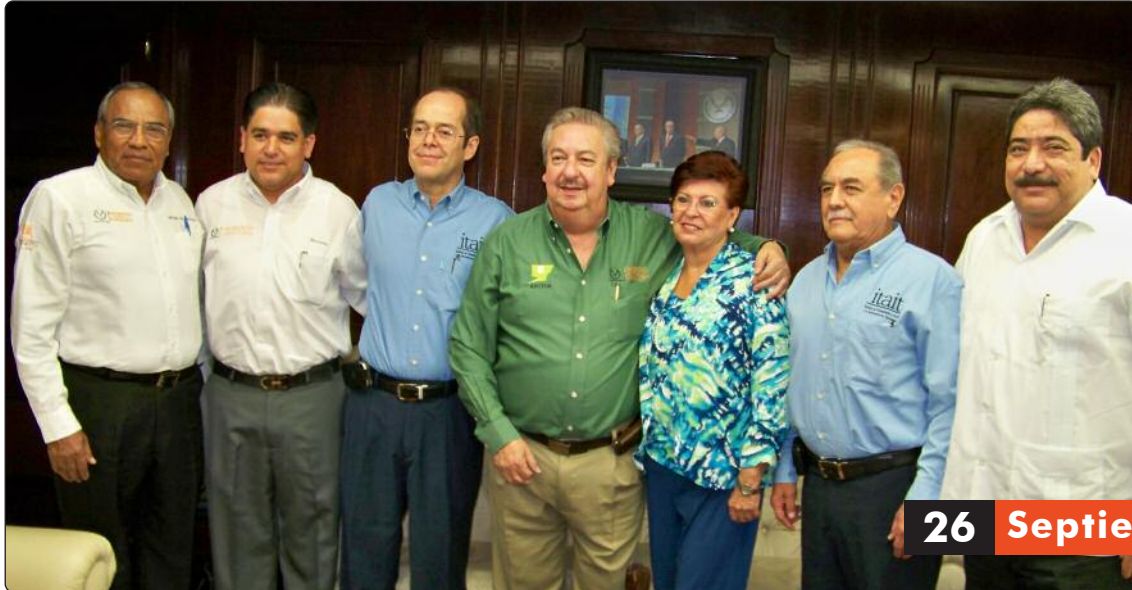
La Universidad Autónoma de Tamaulipas y el ITAIT ratificaron el compromiso de trabajar a la par en el impulso de la difusión del Derecho a la Información, la transparencia, la rendición de cuentas y la protección de datos entre la comunidad universitaria y la sociedad.