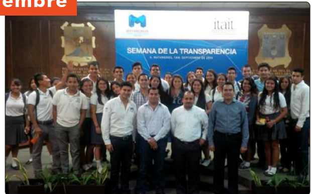
En trabajo coordinado con el municipio de Matamoros, se llevó a cabo la reunión de trabajo en materia de transparencia y rendición de cuentas, así como la conferencia "Redes Sociales y Protección de Datos Personales" a estudiantes de bachillerato.