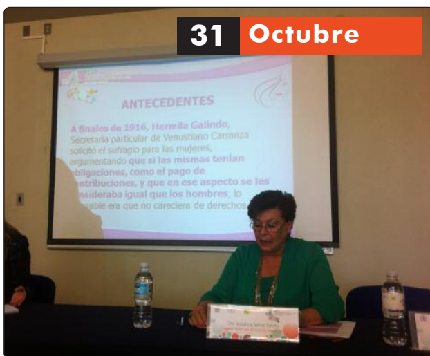
La Comisionada Rosalinda Salinas Treviño expuso "Los Retos de las Instituciones en el Acceso a la Información Pública por condición de género."

A fin de fomentar la participación de las mujeres en el impulso y desarrollo de la cultura de acceso a la información, la transparencia y la protección de datos personales en el país, se llevó a cabo en la Ciudad de San Luis Potosí el 2º Encuentro Nacional de Comisionadas y Consejeras de Transparencia, evento en el que la Comisionada Rosalinda Salinas Treviño participó como oradora en las mesas de análisis, en representación del ITAIT.