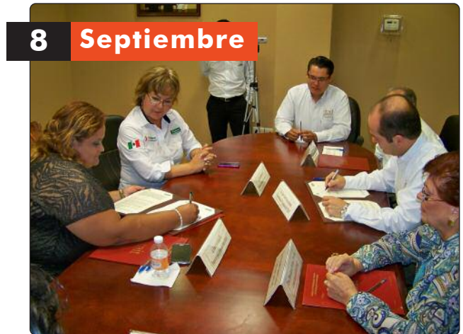
Firma del Convenio de Colaboración institucional entre el ITAIT y el Ayuntamiento de Ciudad Madero.

Tras la firma del acuerdo, ambos organismos dialogaron sobre el trabajo que desarrollan en materia de difusión y capacitación institucional para el desarrollo de la política de transparencia, por lo que acordaron mantener una estrecha colaboración a fin de crear diversos proyectos que permitan seguir impulsando el conocimiento de esos temas entre la sociedad y los servidores públicos del Ayuntamiento firmante.