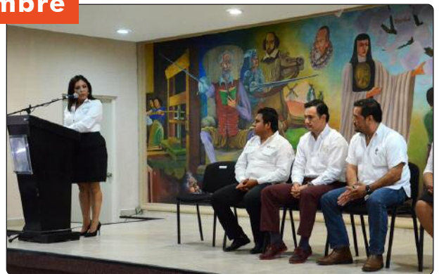
En el Municipio de Altamira se llevaron a cabo reuniones de trabajo con servidores públicos municipales en materia de transparencia, derecho a la información y rendición de cuentas, así como reuniones con organizaciones de la sociedad civil.