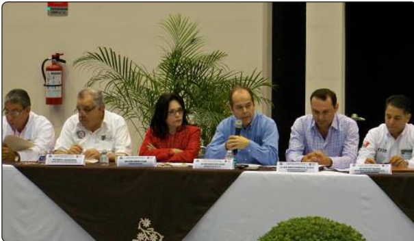
El Comisionado Presidente destacó la importancia del trabajo coordinado entre el ITAIT y las Contralorías Municipales a fin de dar cumplimiento efectivo a las obligaciones de transparencia.