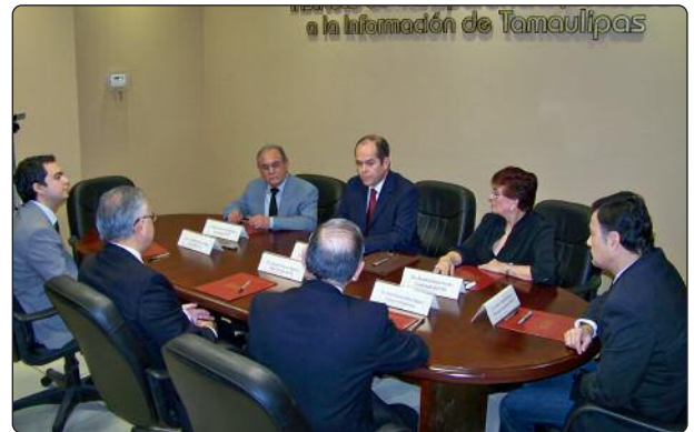
El Comisionado Presidente agradeció a nombre del Pleno del ITAIT, la ratificación del convenio que favorece el desarrollo de la transparencia y suma esfuerzos institucionales en ese sentido.