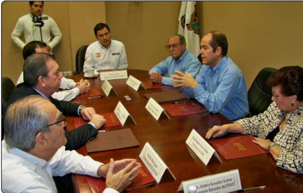
El su visita al ITAIT la representación del Colegio de Tamaulipas conoció el trabajo que realiza el Instituto en materia educativa, así como las áreas de oportunidad que se presenten en el marco de la ratificación del convenio de colaboración.