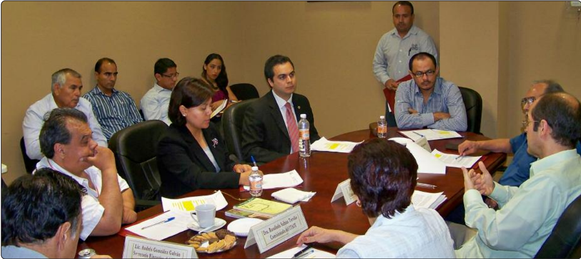
Durante la reunión los Comisionados del ITAIT hablaron sobre la dinámica de la evaluación propiciando el intercambio de opiniones.