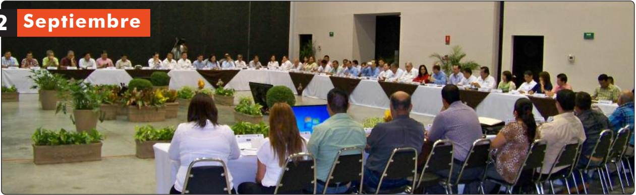
"Panel: Hacia un nuevo Infomex" y "Diálogo Nacional entre Órganos Garantes hacia un Gobierno Abierto"