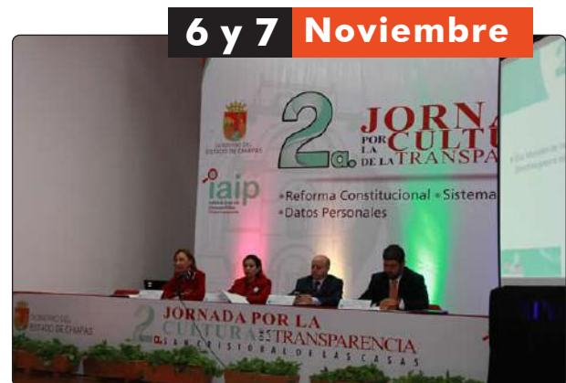
La Segunda Jornada por la Cultura de la Transparencia se llevó a cabo en San Cristóbal de las Casas, Chiapas.

Evento al que acudieron Comisionados(as) y Consejeros(as) de los Organos Garantes del país, a fin de conocer los avances de las políticas de transparencia, de cara a la implementación del Nuevo Sistema Nacional de Transparencia y las propuestas de Ley General. En dicha reunión estuvo presente, la comisionada presidenta del Instituto Federal de Acceso a la Información y Protección de Datos (IFAI), Ximena Puente de la Mora y el presidente de la COMAIP, Javier Rasgado Pérez.