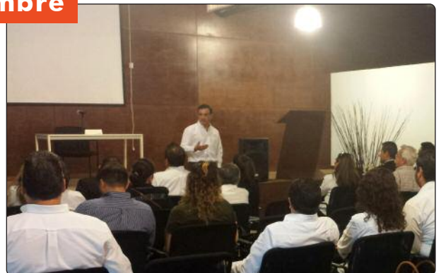
En Nuevo Laredo se llevó a cabo el taller de capacitación a servidores públicos del Ayuntamiento de Nuevo Laredo, reunión de trabajo con organizaciones de la sociedad civil y pláticas sobre derecho a la información y protección de datos personales a estudiantes de bachillerato.