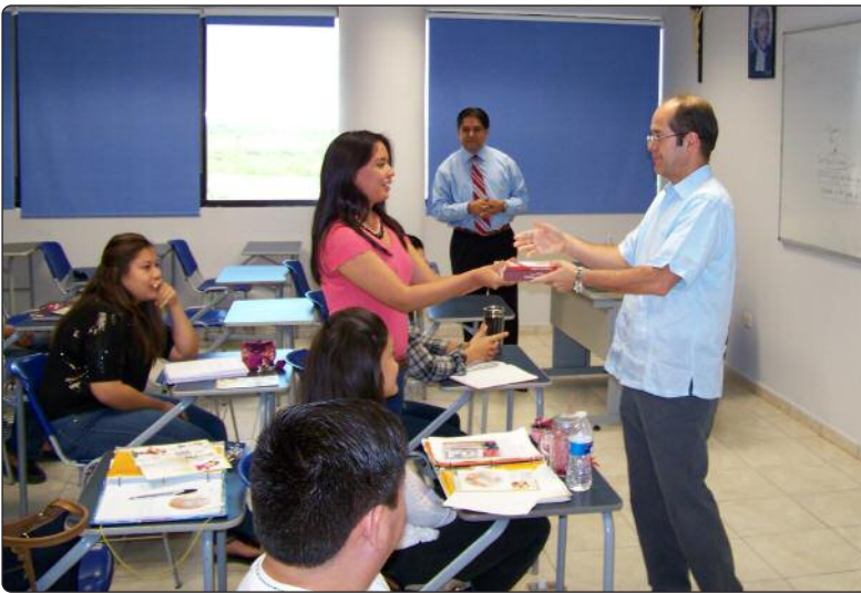
Plática sobre Derecho a la Información y entrega de material bibliográfico a estudiantes de la Universidad La Salle Victoria.