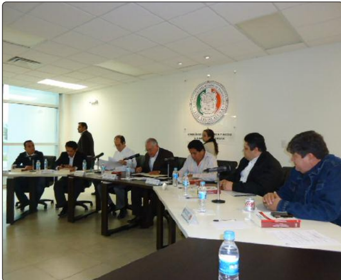
El Comisionado Presidente del ITAIT habló sobre los retos y desafíos de cara al desarrollo del marco normativo en materia de transparencia, resultado de la promulgación de la nueva Ley General de Transparencia.

Con el fin de establecer el primer canal de comunicación del Instituto de Transparencia y Acceso a la Información de Tamaulipas, con la Comisión Ordinaria de Transparencia y Acceso a la Información del H. Congreso del Estado, el Comisionado Presidente, Juan Carlos López Aceves, se reunió con los diputados integrantes de esa comisión, establecida como resultado de la Reforma 2014 a la Ley sobre la Organización y Funcionamiento Internos del Congreso del Estado el 13 de abril de 2014, aprobado el dictamen el 22 de octubre de este año mismo. Acción Legislativa que reformó el Artículo 35, para crearla, con el propósito de fortalecer el Acceso a la Información Pública en el Estado.