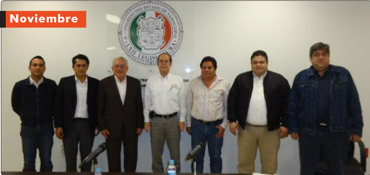
Diputados integrantes de la Comisión Ordinaria de Transparencia y Acceso a la Información del H. Congreso del Estado de Tamaulipas.