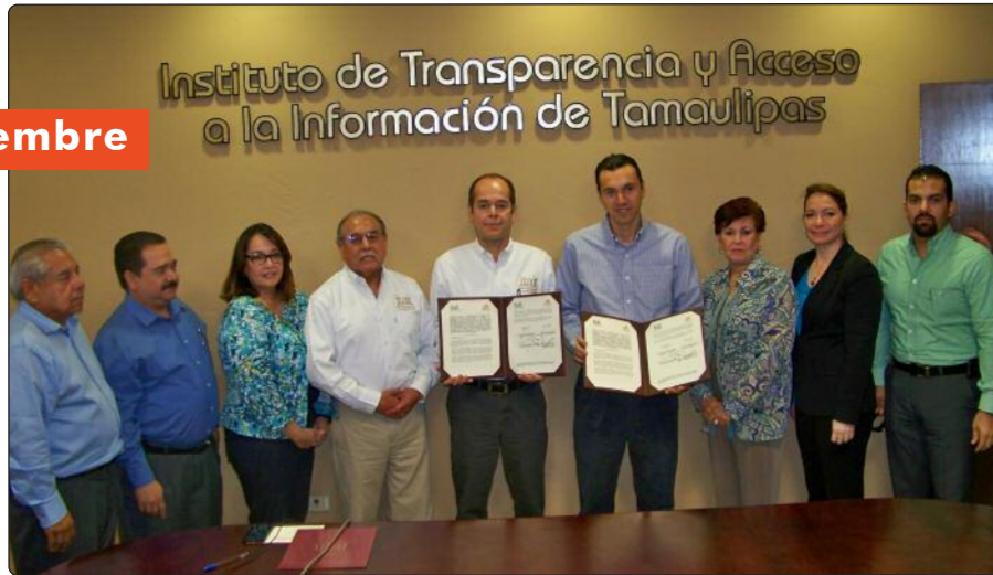
Comisionados y Consejeros Electorales tras la firma del Convenio de Colaboración entre el ITAIT y el Instituto Electoral de Tamaulipas