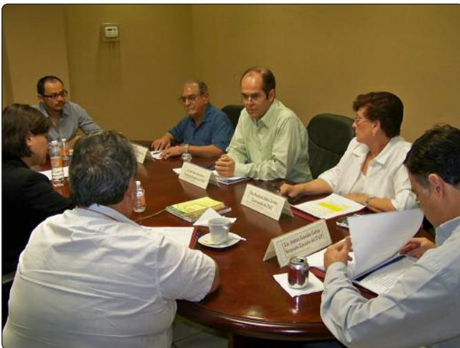
La reunión se llevó a cabo en la Sala de Sesiones del ITAIT.

Los Comisionados del Instituto de Transparencia y Acceso a la Información de Tamaulipas, se reunieron con los titulares de las Unidades de Información y de Archivos, de los organismos sujetos a la evaluación de la Métrica 2014, en la dimensión Sujeto Obligado, que lleva a cabo el Centro de Investigación y Docencia Económicas (CIDE) en todo el país.