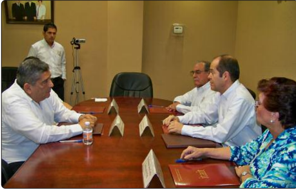
Durante la reunión con el Magistrado Presidente del Tribunal Electoral de Tamaulipas, los Comisionados del ITAIT destacaron la firma del acuerdo de colaboración que suma al esfuerzo institucional en favor de la difusión de la cultura de la transparencia en Tamaulipas.